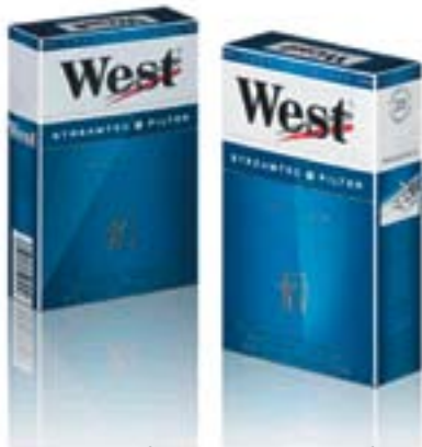
Рис. 2. «Пачка для курительных изделий», запатентованная на имя «Империзл Тобэкко Лимитед» (Великобритания)