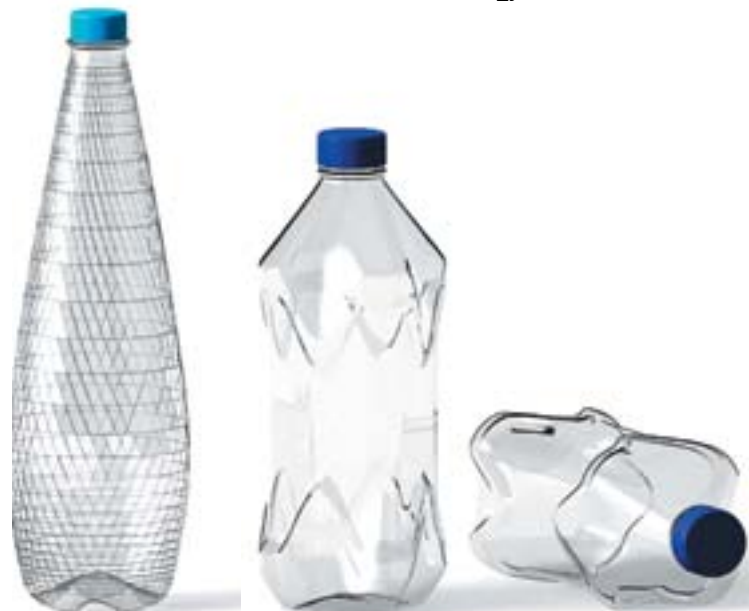
Рис. 1. ПО, запатентованный на имя физического лица Х. Кюна (Германия)

целесообразно также подать заявки на отдельные элементы набора (то есть на части и на целое).